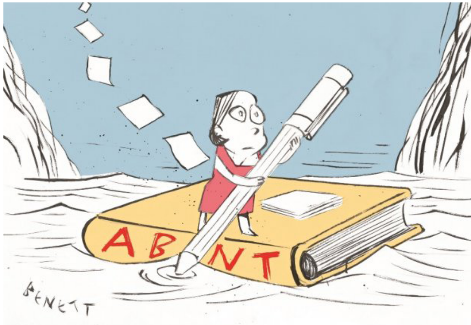
Figura 2 – Exemplo de figura