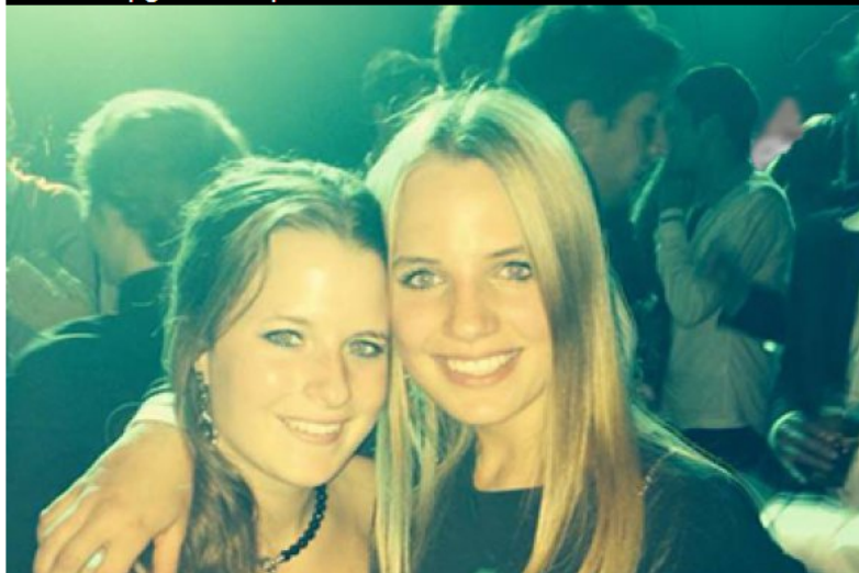
SOFIA - Tijdens een feestje, ter ere van schijver en dichter Ivan vazov, werd de vermiste B. gespot op een foto.