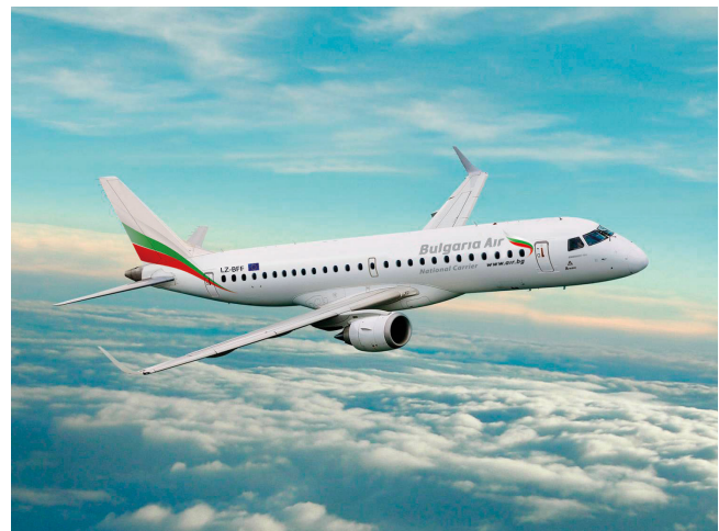
Figuur 1. Kampindicatie