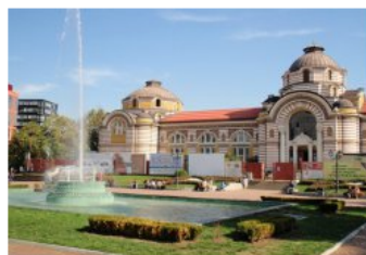
Boulevard Maria Luisa, Sofia, Bulgarije