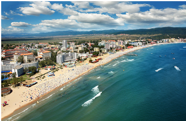
Figuur 2. Sunny Beach

Beschrijving dagplanning 1 , de speluitwerkingen vind je telkens onder 'Speluitwerkingen', een hyperlink naar een bepaalde speluitwerking maak je zo Stadsspel of zo Run and Hide . Als plan B kan er steeds verwezen worden naar het Back-up programma.